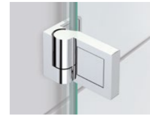
Band Glas/Wand Hinge glass/wall