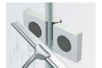
Flächenbündige Glasbefestigung, einfache Reinigung von innen Countersunk glass fixing, easy to clean from inside