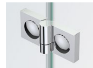
Band Glas/Glas 180° (mit runden Abdeckkappen) | Hinge glass/glass 180° (with round cover caps)