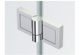
Band Glas/Glas 180° (mit eckigen Abdeckkappen) | Hinge glass/glass 180° (with square cover caps)