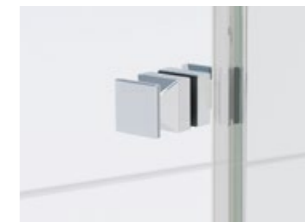
Türknope eckig | Door knob square